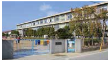
広畑第二小学校 徒歩約2分(160m)