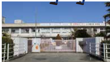
広畑中学校 徒歩約2分(160m)