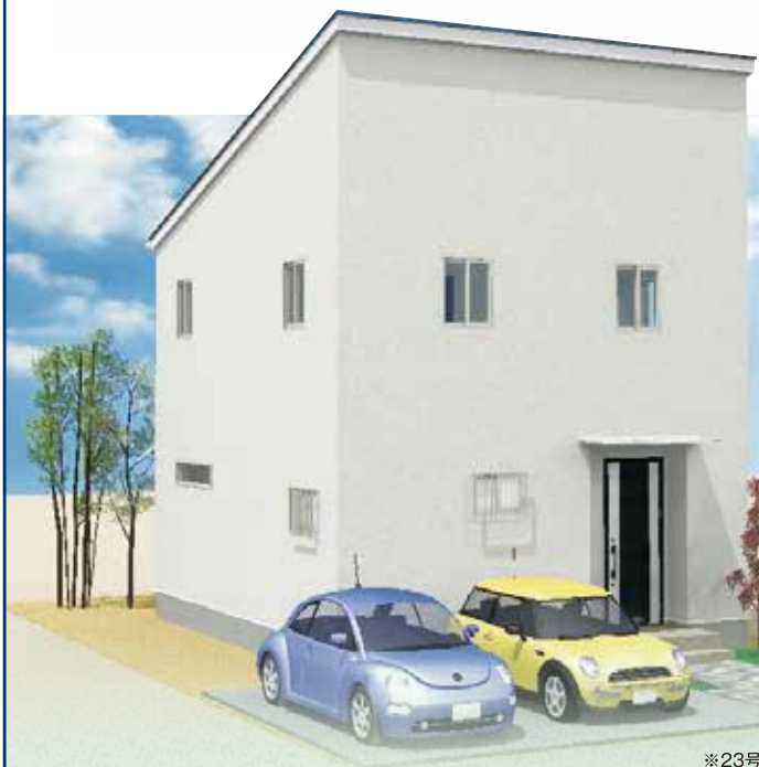
※23号地外観完成イメージ