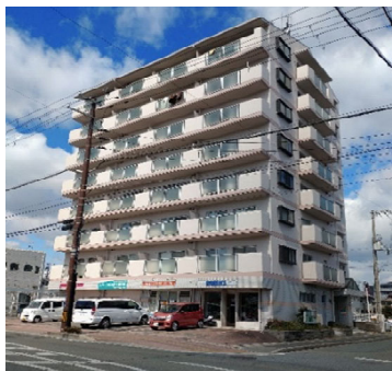
※ 物件地図 ※